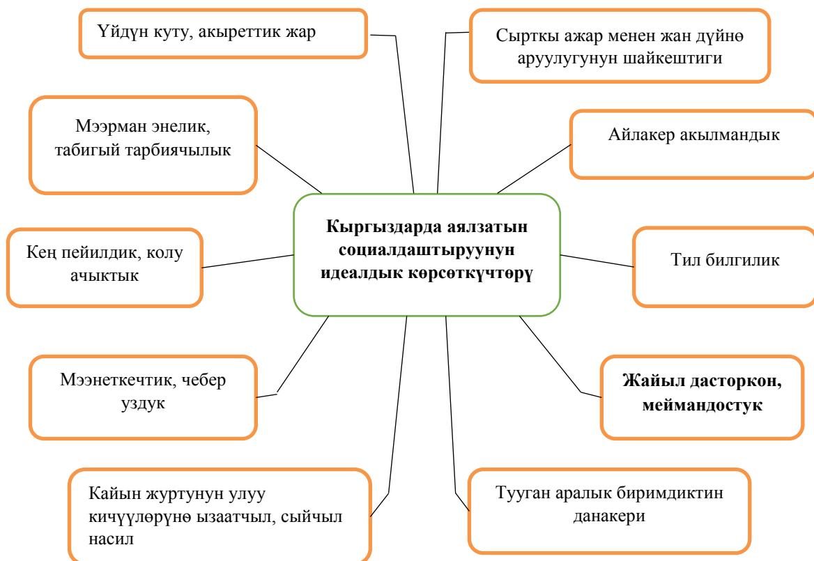
1-сүрөт. Кыргыздарда аялзатын социалдаштыруунун идеалдык көрсөткүчтөрү.